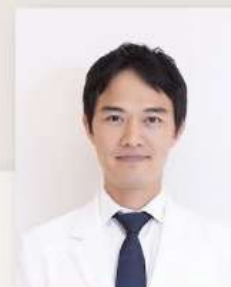
7daysモニターにご協力いただきました。 美容系オンラインサロン リゾナス美ラボ所長

いつもなら治るまで二週間かかる口内炎が、次の日には傷が塞がっていて驚きました。はじめてCBDを接種した日は、熱で扁桃腺がバンバンに腫れていたのですが、次の日起きたら喉の痛みがびっくりするくらい消えていました。